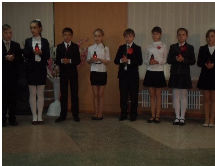
Участь у районній акції «Свіча пам'яті» та "Стрічка миру"