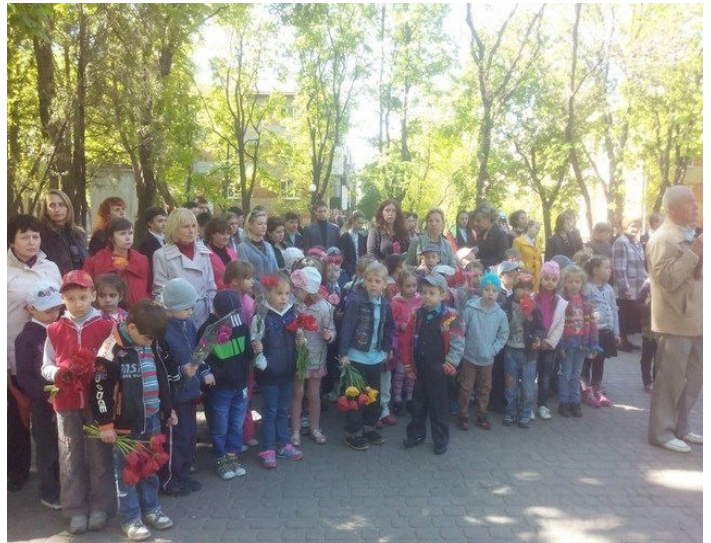
Участь у мітингу та покладанні квітів у сквері ім. П.Кандаурова